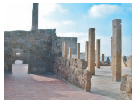
Tonnara di Vendicari. Prospettiva dall'ingresso del museo.