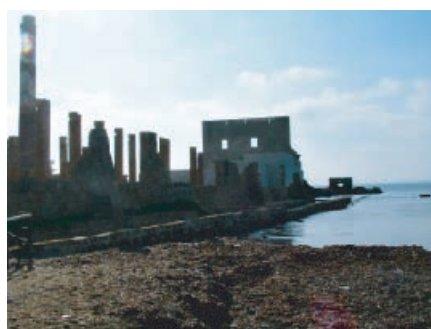
Tonnara di Vendicari.